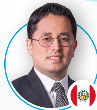
Piero Cortina Gonzáles Rodríguez Angobaldo Abogados