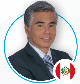
Fernando Nakaya Torres y Torres Lara Abogados