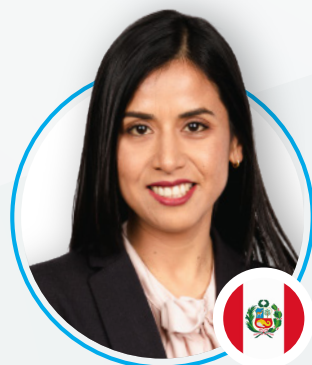
Romina Segura Estudio Ehecopar Asociado a Baker & McKenzie International