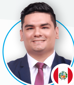
Omar Mestanza Philippi Prietocarrizosa Ferrero DU & Uria