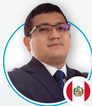
Luis Puglianini Barrios & Fuentes Abogados