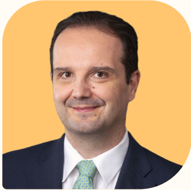
ADOLFO MENENDEZ SECRETARIAT ESTADOS UNIDOS